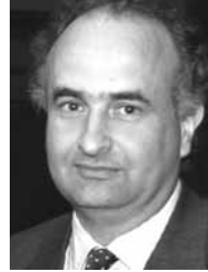
Agustín J. Edwards Vicepresidente de Empresa El Mercurio