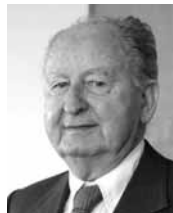
Helios Piquer 1970